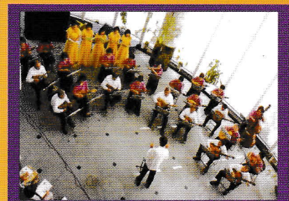
マンドリン アンサンブル まほろば